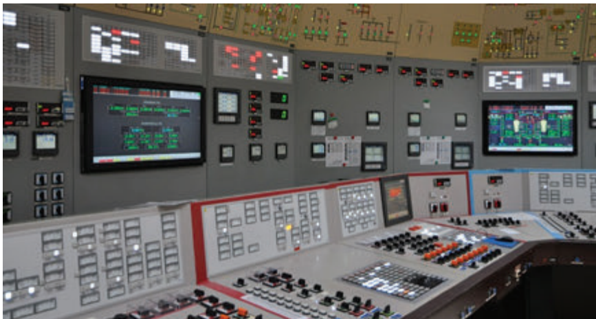
Hlavními produkty I&C Energo jsou Servis, Investiční dodávky a Optimalizace energetických výroben