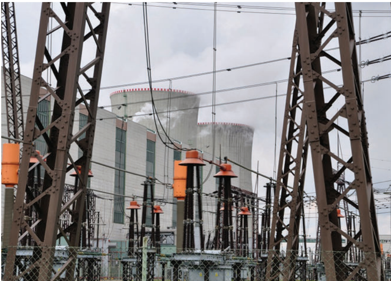
Firma chce být připravena se podílet na budoucí výstavbu jaderných bloků v České republice