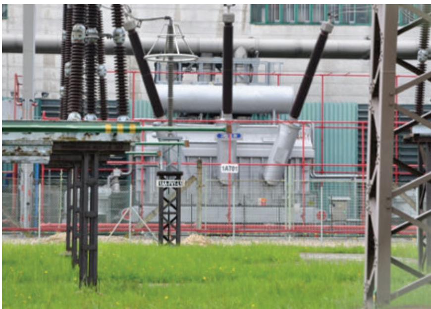
Pro I&C Energo je hlavním segmentem trhu výroba a distribuce elektrické energie

Ze Servisu vyplývající dlouholetá znalost technologie a provozování jaderných i klasických bloků je nenahraditelnou podstatou firemního know-how a klíčovým faktorem rozvoje produktů - Investiční dodávky a Optimalizace energetických výroben. Ambice I&C Energo nabízet zákazníkům technicko-ekonomickou optimalizaci jejich provozů vychází z dlouholeté znalosti jejich provozování a schopnosti hledat, realizovat a rozvíjet řešení v oblasti asset managementu a řízení technologických procesů.