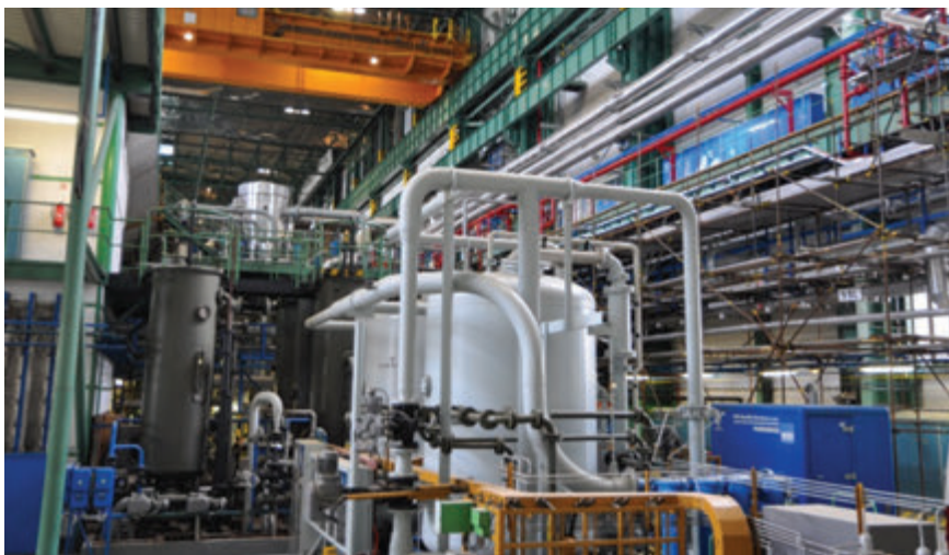
Společnost rozšířila nabídku i ve strojních činnostech, a to v rámci projekčních činností, dodávek, instalací, testování a uvádění do provozu