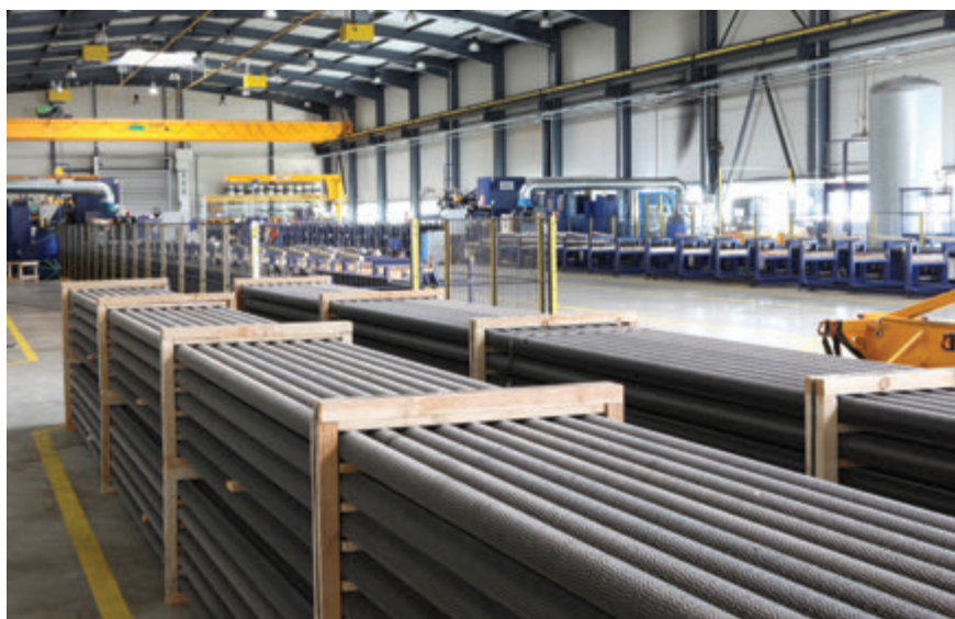
Výrobný závod na výrobu vysokokvalitných rebrovaných rúr