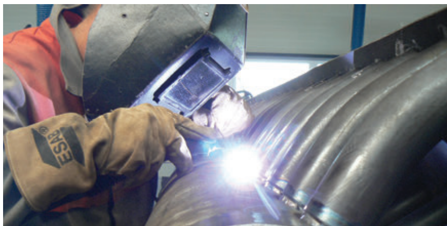
Zváranie kotlových dielcov