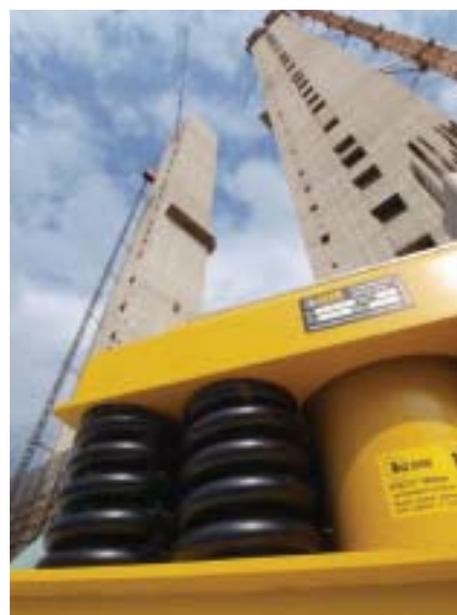
Obrázek základů s „gerby“

řešen jako železobetonový skelet o rozměrech 20 × 90 × 39 m. Uvnitř objektu jsou dva portálové jeřáby o nosnosti 48 a 12,5 tun, které jsou do stavby zabudovány již v průběhu betonářských prací.