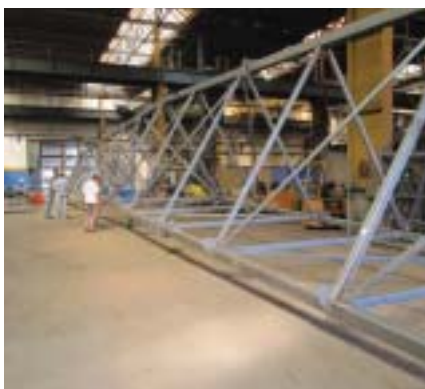
Obrázek vazníku připraveného k montáži

Jedná se o objekt půdorysných rozměrů 45 × 90 m. Výška je tvořena do výšky 15,0 m železobetonovou konstrukcí s vyzdívkami z tvárnice YTONG. Do výšky 41 navazuje na železobetonovou konstrukci ocelová konstrukce. Její zajímavostí je osová vzdálenost hlavních sloupů 12 m, na nichž je osazena jeřábová dráha o výšce nosníků 1,2 m. Vazníky pro střešní pláště mají rozpon 40 m a jsou navrženy jako prostorová příhradová konstrukce. Výška vazníku je 3,5 m. Na vaznicích jsou osazeny vaznice, které nesou konstrukci střechy z trapézových plechů, tepelné izolace a folie.