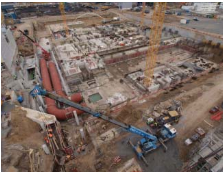
Pohled na potrubí pro chladicí vodu

že se jí v rámci tohoto článku budeme věnovat podrobněji v jeho závěru (pozn. redakce). Zahajovalo se na kótě - 4,60 m a končilo na kótě + 140,3 m, takže celková výška tažených věží je 144,9 m.