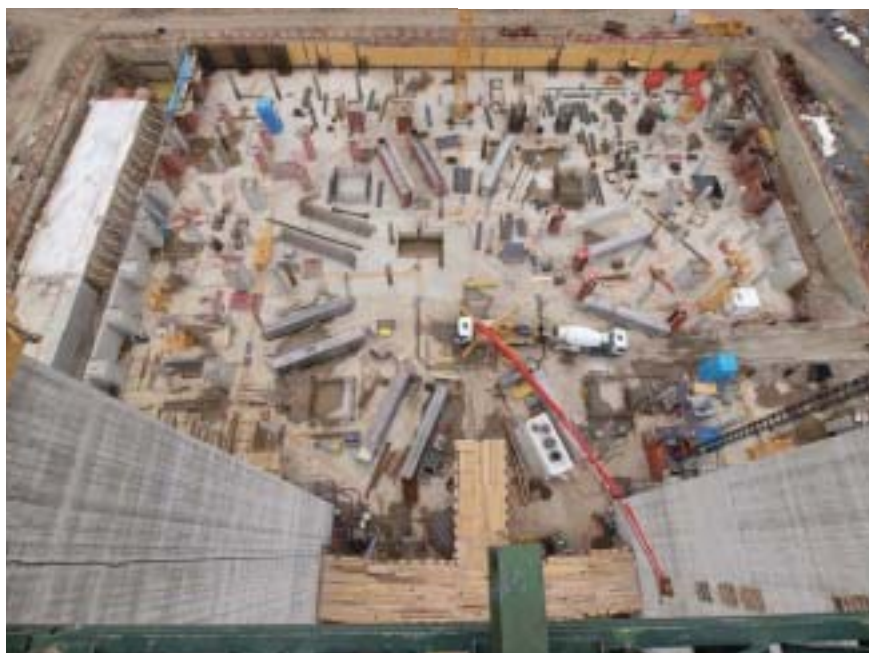
Pohled na stavenišťě z ptáčích perspektivy