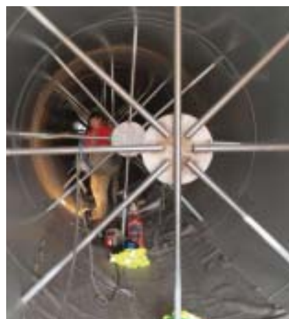
Výztuhy uvnitř potrubí

Objekt kotelny z konstrukčního hlediska tvoří železobetonové obvodové stěny s vnitřními sloupy a železobetonovou deskou. Zajímavostí jsou čtyři masivní sloupy průřezu 5 × 5 m tvořící nosnou konstrukci kotle a osm základů pro konstrukci mlýnů. Základy jsou tvořeny pasy nad deskou, na kterých jsou umístěny pružné podpory od firmy Gerb a betonovými bloky osazenými na těchto „gerbech“. Prvky zajišťují pružné uložení masivních bloků základů mlýnů sloužících k rozmělnování uhlí. Pružné uložení je vyžadováno z důvodu dynamického zatížení a vibrací způsobovaných činnostmi mlýnů.