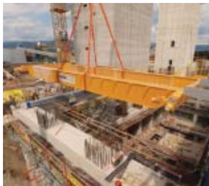
Obrázek z montáže jeřábu

Na objekt strojovny navazuje bezprostředně objekt mezistrojovny. Konstrukčně je objekt