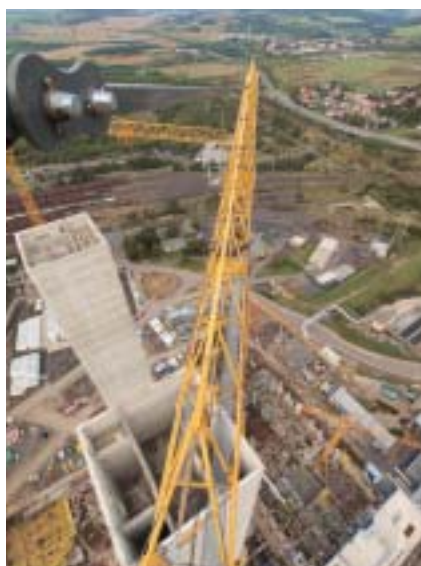
Pohled do útrobu věží a rozčlenění vnitřního prostoru

řešen jako železobetonový skelet o rozměrech 20 × 90 × 39 m. Uvnitř objektu jsou dva portálové jeřáby o nosnosti 48 a 12,5 tun, které jsou do stavby zabudovány již v průběhu betonářských prací.