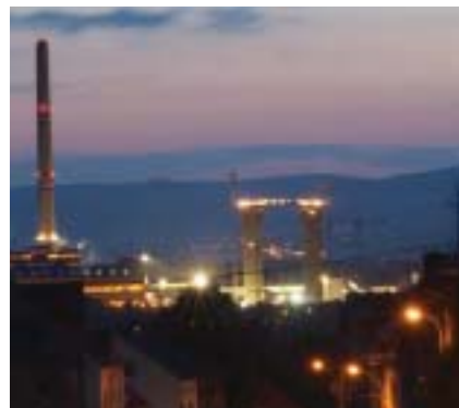
Noční snímek na stavenišťě z městečka Bílina