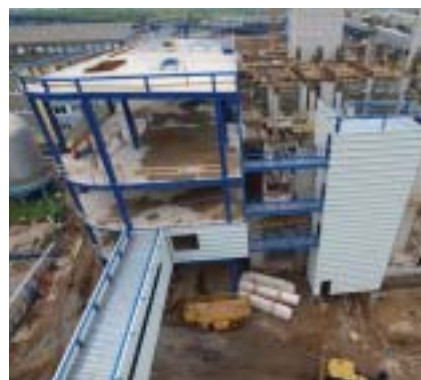
Snímek z výstavby Dozorny - aktuální stav

Jde o konstrukci půdorysných rozměrů 18,0 × 55 m a výšky 23,6 m. Tvoří ji ocelový skelet se stropy betonovanými do trapézových plechů. Objekt má pět nadzemních podlaží, z nichž první dvě jsou uzpůsobena pro projíždění nákladních