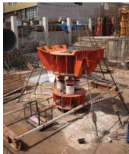
Snímek ze zatěžovací zkoušky pilot