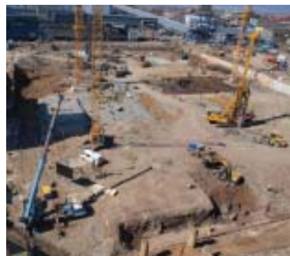
Pro zajištění stavebních jam byly použity milánské stěny, převrtávané pilotové stěny a jílocementové stěny

Založení objektů je provedeno na vrтанých pilotách. Území stavby je problematické nerovnoměrnou polohou čedičových vrstev, které je možné na jednom objektu zastihnout v hloubce 6 m pod základovou spárou a o 10 m dále se vůbec nevyskytují. Vzhledem k předepsanému maximálnímu sednutí piloty do 5 mm a vysokému zatížení bylo nutné provést zatěžovací zkoušky vybraných pilot, které potvrdily teoretické výpočty.