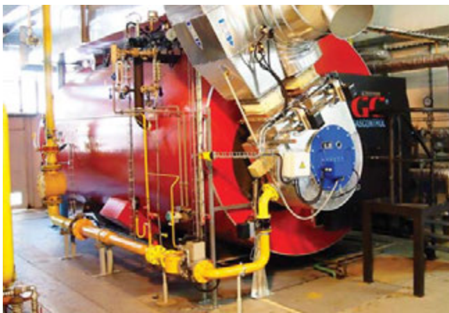
Obr. 2 – Speciální hořák