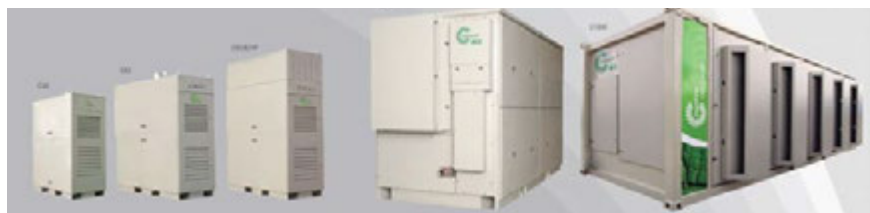
Výkonová řada mikroturbín Capstone

Spalovací turbína na zemní plyn je umístěna v exteriéru bezprostředně u kotelny (obr. 3) a vyráběná elektrická energie je vedena novou kabelovou trasou do stávající rozvodny. Energie spalín s velkým přebytkem vzduchu je využita v parním kotli, viz obr. 1. Parní kotel je vybaven speciálním hořákem, který využívá spaliny jako spalovací vzduch, viz obr. 2. Tímto je využita