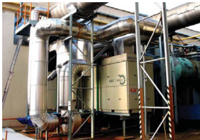
Obr. 3 – Spalovací turbína u kotelny