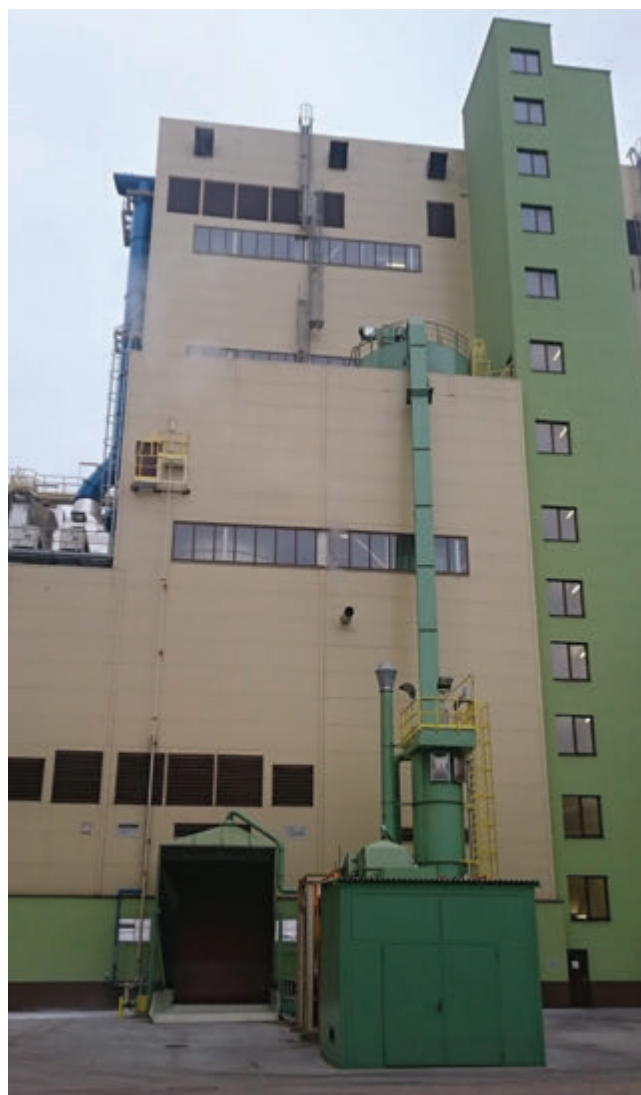
Budova nového kotla NK 14