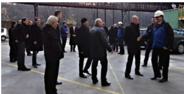
Slávnostné uvedenie do prevádzky