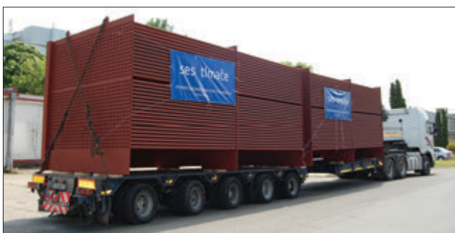
Doprava ohrievačov vzduchu

SLOVENSKÉ ENERGETICKÉ STROJÁRNE, a. s., Tlmače