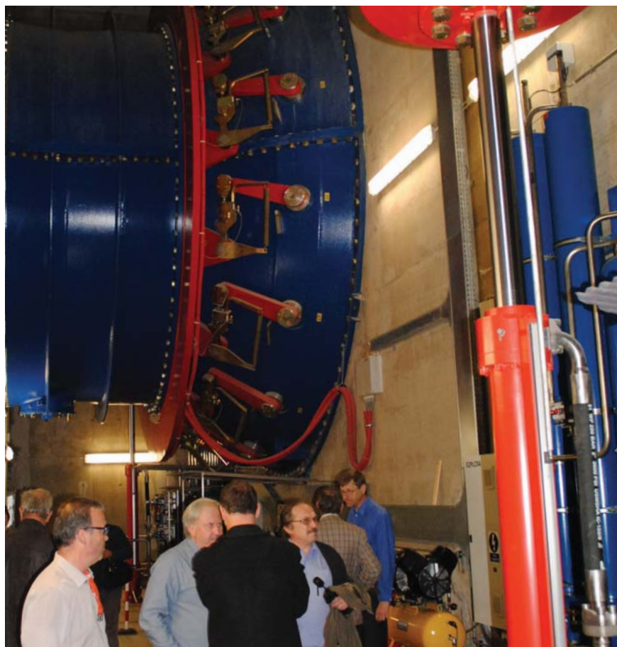
Pohled na oběžné kolo elektrárny ve Štětí

Dne 27. února 2015 investor načerpal celkem 878 milionů korun, které použil na uhrazení ceny díla dodavatelé. Celkové investiční náklady projektu byly ještě o několik desítek milionů korun vyšší. Komerční banka nefinancuje 100 % investičních nákladů projektu. Kromě vlastních zdrojů investora, získaných prostřednictvím darů, se na financování MVE Štětí výraznou měrou podílí dotace z programů OPPI