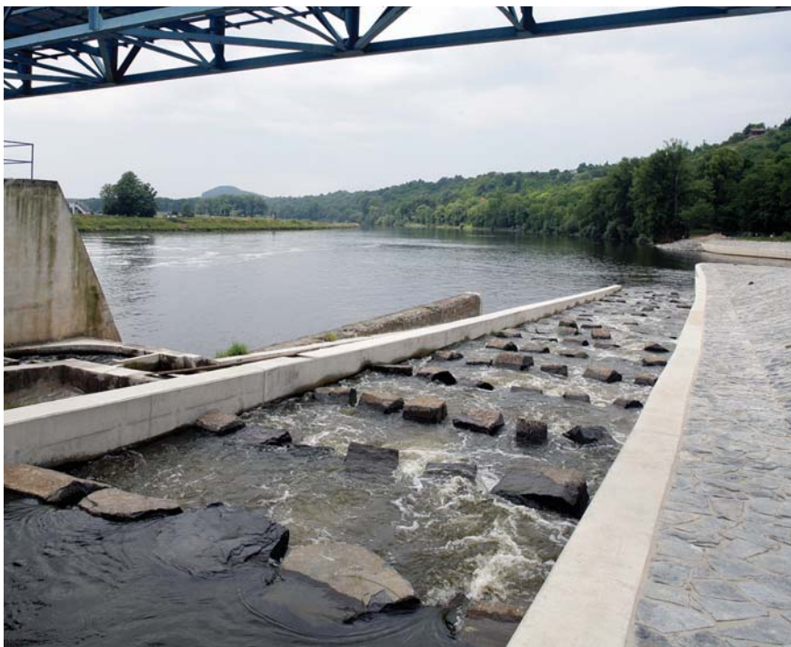
Prostor pro průplav ryb

a OPŽP (Operační program Životní prostředí). Po zdárném proplacení obou dotací v roce 2015 dojde ke snížení načerpaného úvěru na přibližně 620 milionů korun.