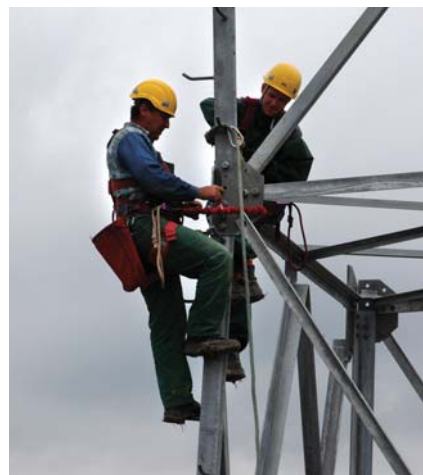
Momentka z výstavby vedení - ilustrační foto

V roce 2003 vystudoval Vysokou školu ekonomickou v Praze (Fakulta mezinárodních vztahů). V roce 2006 získal titul Mgr. na Karlově Univerzitě v Praze. V letech 2005 a 2006 studoval na Utrecht University (School of Law) v Holandsku. Postupně pracoval v české Komisi pro cenné papíry, v České národní bance, v advokátní kanceláři Havel, Holásek & Partners, dále pak ve společnosti Procter & Gamble. V lednu 2008 nastoupil jako právník do společnosti EP Investment Advisors. V listopadu 2013 se stal generálním ředitelem EP Industries, a.s.